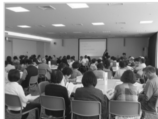
ふれあいサロン情報交換会

平成30年度も上記事業の他、地域福祉・高齢・障害・児童・広報活動等さまざまな事業に、会費を使わせていただきます。