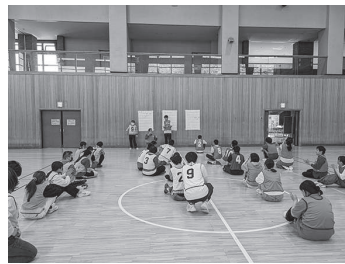
▲チーム分けを行いルール説明

開催：毎月第2日曜日 10:00～12:00 (季節やイベントにより変更する場合があります) 場所：大穂体育館（つくば市筑穂1-10-4） 対象：市内在住の知的障害がある中学生～30歳位 ※参加方法等、詳細は下記問合せ先までご連絡ください。