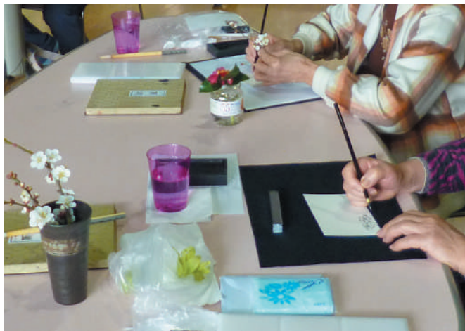
▲絵手紙@老人福祉センターとよさと