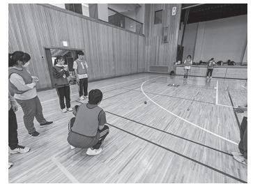
▲ボッチャをしている様子