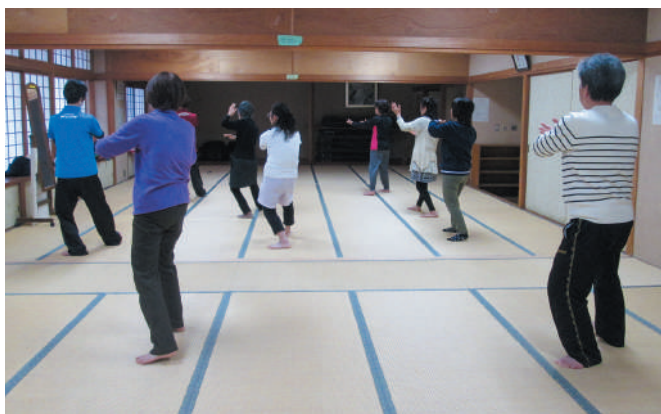
▲ゆったりのびのび太極拳@大穂交流センター

自宅に閉じこもりがちな高齢者に趣味や新しい生きがい活動を見つけてもらえるよう「いきいきサロン（市から受託）」を市内の老人福祉センター等で週1回ずつ開設しています。