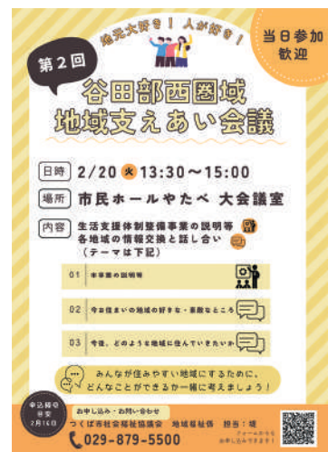
▲令和5年地域支えあい会議 第2回チラシ