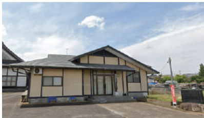
▲大砂田園都市センター 周りには素敵な景色が広がっています

大砂さくら会は、毎月第1日曜日10:00～11:30に大砂田園都市センターで活動しており、地域住民が気軽に集まり、お茶菓子を食べながら何気ない会話を楽しんでいます。参加者からは「家に居てもつまらないから、集まりがあると嬉しい」との声がありました。始まったばかりですが、皆さんの特別な居場所となっています。サロンの代表者は「大砂は昔からつながりが強い」と話しており、実際に一人の女性のつぶやきから、サロンが立ち上がるまで数カ月しかかかりませんでした。サロンの周知は区会回覧で行っていましたが、皆さんで声をかけあったことで、人が集まり新しいサロンが生まれました。サロンの立ち上げをきっかけに“地域のつながりの強さ”を改めて感じました。