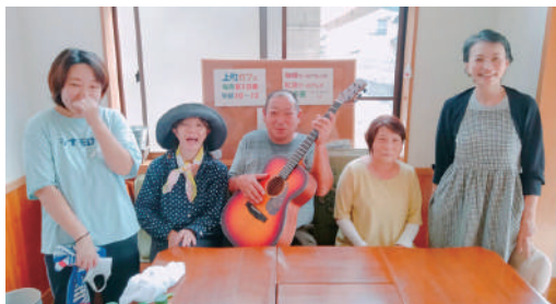
▲皆さん楽しく活動しています

吉沼で行われている活動を紹介しします。前年度「吉沼まちかどテラス」のカフェで「歌声喫茶」を開催しました。今年度は、地区の集会所に場所を移して「上町カフェ 2024 ～たまり場・歌う集会所～」を開催しています。集まった住民同士で、楽しくおしゃべりや飲食、懐かしのフォークソングや昭和歌謡曲と一緒に聴いたり、歌ったりしています。活動を通して、地域の関係性づくりができる「集いの場」です。興味のある方はどなたでも大歓迎です！ぜひ、みなさんご参加ください!!