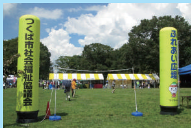
▲ふれあい広場は中央公園 (センター広場北側が会場です)