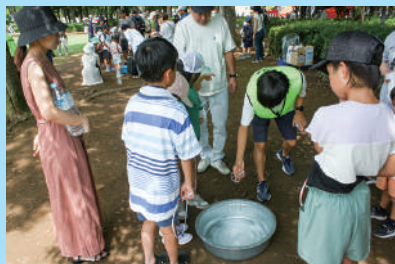
▲大きなシャボン玉を作ろう!