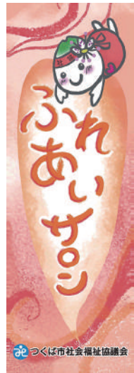
▲のぼり旗が 活動の目印です