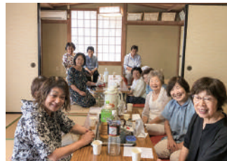
▲笑顔が溢れています