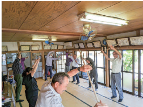
▲しっかり準備体操

会場準備の後、吹き矢の筒を持ってストレッチをします。次に、指導者に基本動作を習います。スポーツ吹き矢は、1998年に生まれた新しいスポーツですが、武術のように礼に始まり礼に終わります。集中力と精神力を息に込めて腹式呼吸を使い、6メートル先の円形の的をめがけ、息を使って矢を放ちます。皆さん初めての経験で「届くかなあ」と心配していましたが、的に命中すると「おおー！」と歓声が上がリ、とても盛り上がりました😊「次はいつやる？」と次回の予定も決まったようです。