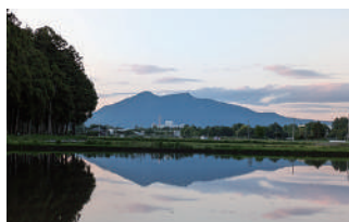
▲田植え前の田んぼに映る筑波山

あっという間に半年が過ぎてしまいました🌸今年の夏も酷暑ですね。暑さに負けないように、こまめに水分や塩分を補給し、休憩をとってくれぐれもご自愛ください😊