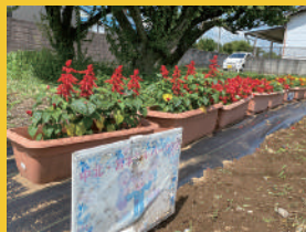
上河原崎の交差点に設置中！▶ ぜひご覧ください。