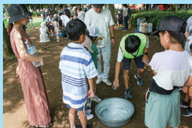
▲大きなシャボン玉を作ろう!