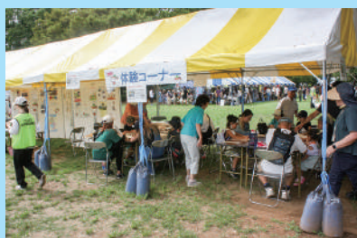
▲20団体のブースや体験コーナーも用意

「ふれあい広場」は、福祉関係団体やボランティア団体が実施する様々な企画やバザーを通して、日頃の活動を来場者に知っていただき、福祉への関心や理解を深めてもらうことを目的に開催しています。