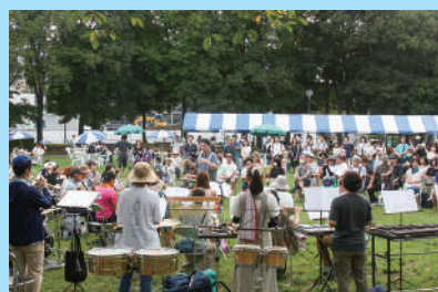
▲素敵な演奏をお楽しみください