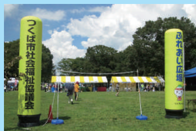
▲ふれあい広場は中央公園 (センター広場北側が会場です)