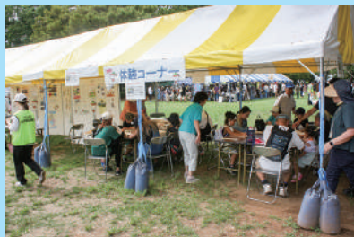
▲20団体のブースや体験コーナーも用意

「ふれあい広場」は、福祉関係団体やボランティア団体が実施する様々な企画やバザーを通して、日頃の活動を来場者に知っていただき、福祉への関心や理解を深めてもらうことを目的に開催しています。