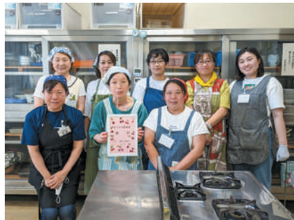
▲寄付などで集まった食材を心を込めて調理しています！

初めての開催で反省点も多く出たとのことですが、改善しながらより良い居場所づくりを進めていただければと思います！