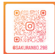
▲さくらんぼ食堂 Instagram 【最新情報はコチラ】