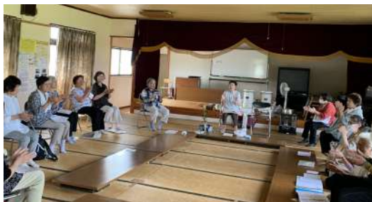
▲ふれあいサロン きずなの様子

上田中地区では、地域のみなさんが元気に楽しく参加できる場として、様々な活動や交流が行われています。日々の交流があることは、ちょっとした困りごとや必要な情報が欲しい時などの、声のかけやすさや相談のしやすさにもつながります。上田中地区では以下の3つの活動が定期的に行われ、みんなの活力になっています。