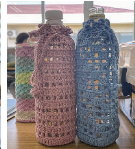
▲ペットボトルや水筒用のカバーを作ります