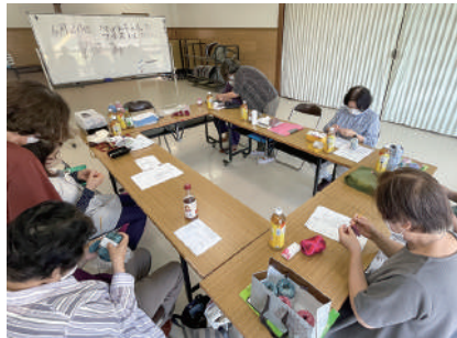
▲みんなで編み物をしました

参加者の皆さんはサロンの日を楽しみにしており、代表の方も「会員みんなが70歳以上だけれども、いつまでも元気で楽しくサロン活動を行いたい」と話していました。荃崎地区の方であれば、新規参加者も大歓迎とのことですので、興味がある方は下記コーディネーターまでご連絡ください。