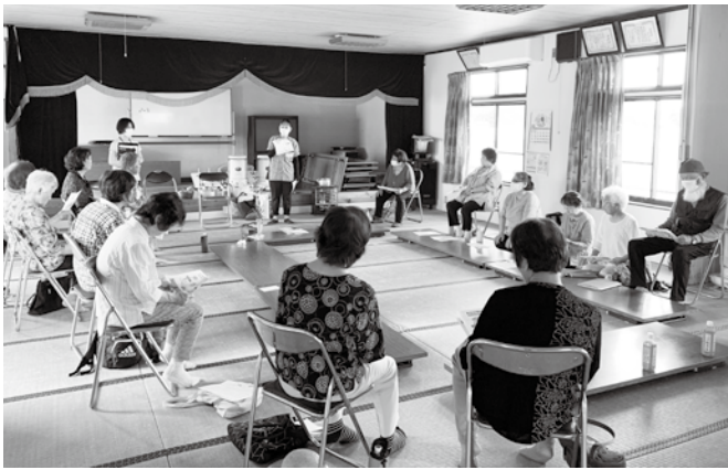
毎回楽しく活動中