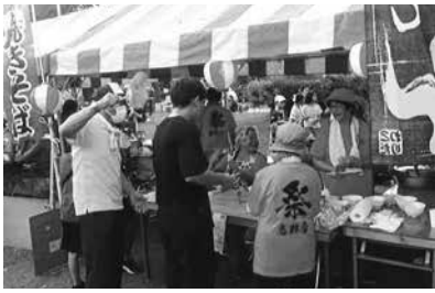
コロナ禍を乗り越え再開となった夏祭り

1983年に居住者の融和団結を目的に始まった、「高野台夏祭り」はコロナ禍の影響で中止でしたが、規模を縮小した「第38回高野台夏祭り」が今年の7月20日(土)に開催されました。