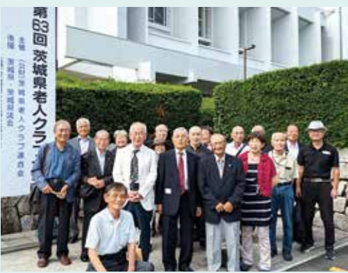
受賞者の皆さんと本部役員など

受賞された方々は、長きにわたりシルバークラブの発展に寄与されている皆様です。心よりお祝い申し上げます。