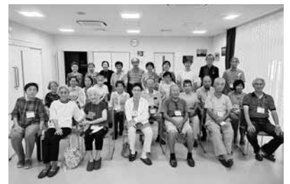
オリジナルソングの歌唱練習中

曲は無理だろう、何かの替え歌で作詞ならできるか」と思い、会員の方々に募集したところ、とても良いフレーズがたくさん集まりました。あれも、これもと入ったので、何だか変かなあ? とも思えました。心を合わせて作ったものでマァいいか!