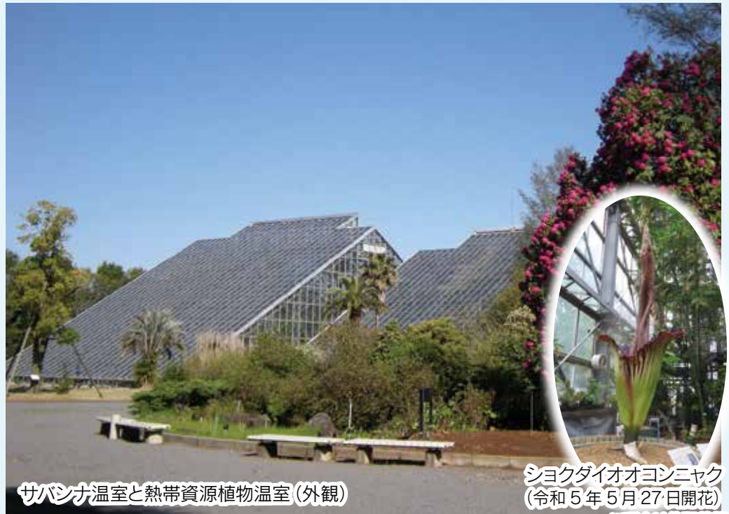
サバナ温室と熱帯資源植物温室（外観）

国立科学博物館 — 筑波実験植物園 — 1983年（昭和58年）10月に開園した植物の研究機関です。植物の多様性を知り、守り、伝えることを使命に、研究、保全、展示、学習支援活動が行われています。 約14万㎡の園内では、およそ3000種類の植物を観賞しながら散策を楽しめます（65歳以上の方は、証明書提示にて無料で入園できます）。