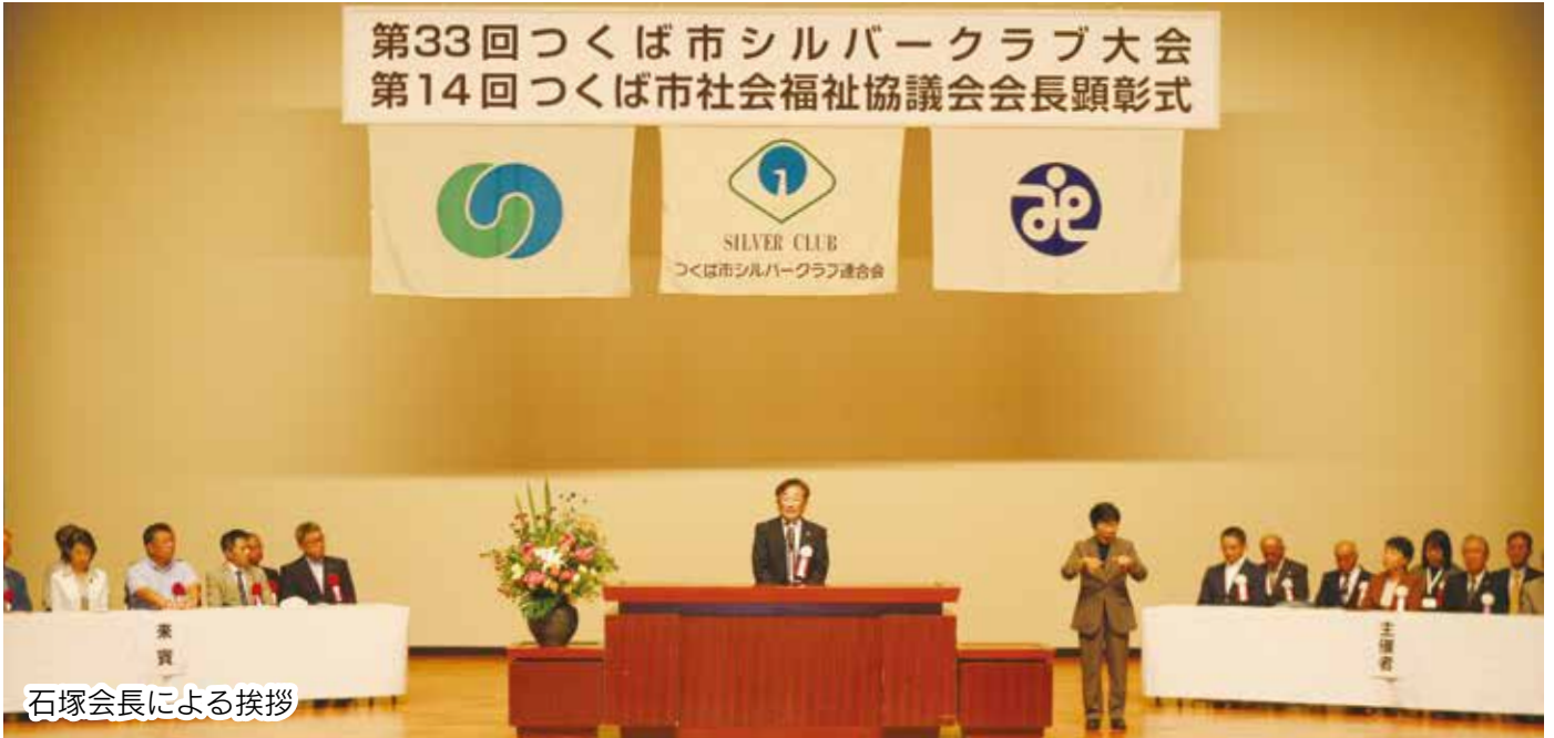
石塚会長による挨拶