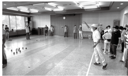
勝利を目指して、一投に集中