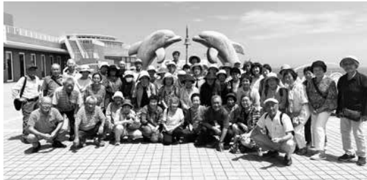
大洗水族館イルカ像の前で笑顔

7月18日に大穂地区シルバークラブで水戸・大洗方面に行きました。最初にバスで水戸の弘道館に向かい、国の重要文化財に指定されている正門、正庁、至善堂など歴史ある建物を見学しました。建物の中は縁側や中廊で仕切られており、暑い日でしたが涼しさを感じ