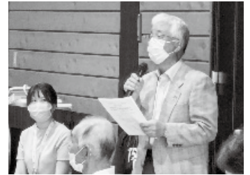
1人1人の協力が重要であると再認識