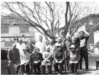
笑顔あふれる会員 元気に活動中

彼らの明るい笑顔が私たちの健康寿命を延ばすと信じ、会員の健康に留意しながら楽しく務めております。