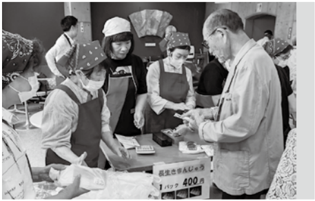
あっという間に完売しました