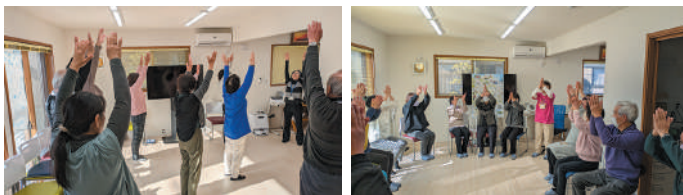
▲リフレッシュ・ケア ▲笑いヨガ