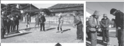
輪投げ大会の様子! みんな頑張っています、なかなか