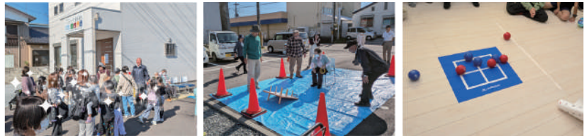
▲たくさん集まってくれました ▲天気がいいので外でわなげ ▲ポッチャの体験

茨城県民の日で小学校がお休みということもあり、たくさん子ども達が参加してくれ大盛況！輪投げやポッチャ、竹とんぼなど、まぶしい笑顔があふれていました。多世代向けイベントの他、月に一回程度平日でも参加できる方を対象に、すこやかライフ(ストレッチなどの体操)や笑いヨガなど様々な活動を行っております！興味のある方はお気軽に遊びに来てください！